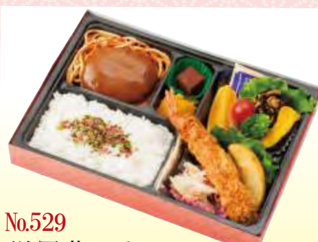
No.529 洋風幕の内 27.5×19.0 cm ¥1,100+消費税