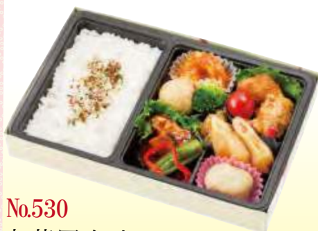
No.530 中華風弁当 27.6×18.2 cm ¥1,100+消費税