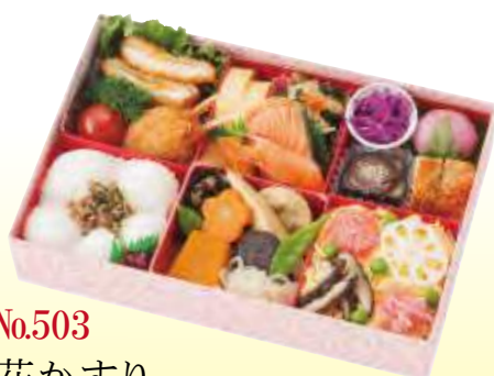
No.503 花かすり 25.0×17.0 cm ¥1,600+消費税