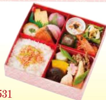
No.531 花あわせ 17.4×17.4 cm ¥1,100+消費税