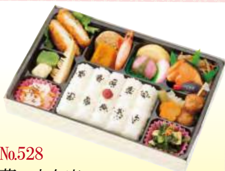
No.528 幕の内弁当 27.6×18.2 cm ¥1,100+消費税