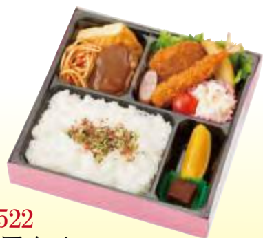
No.522 洋風弁当 21.4×21.4 cm ¥950+消費税