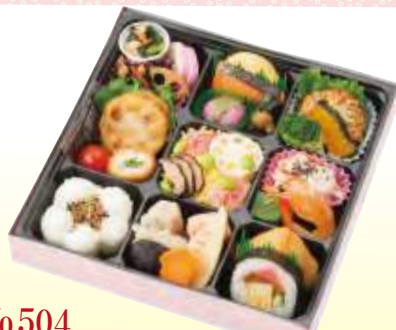
No.504 花こもん 25.0×25.0 cm ¥1,400+消費税