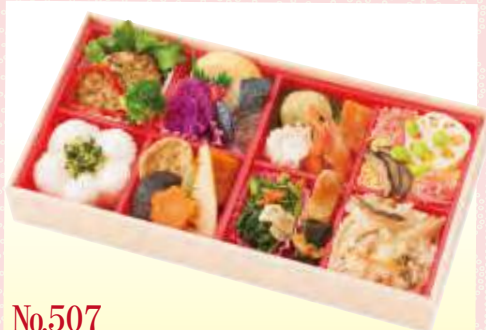
No.507 すみれ 30.0×16.0 cm ¥1,300+消費税