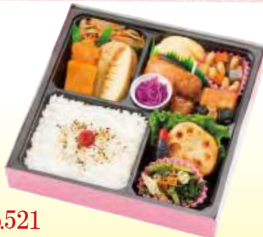
No.521 和風弁当 21.4×21.4 cm ¥950+消費税