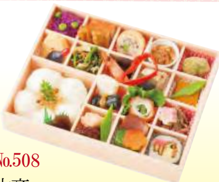
No.508 六斎 24.0×18.5 cm ¥2,100+消費税