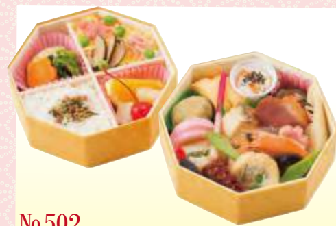
No.502 双葉 14.5×14.5 cm ¥1,600+消費税