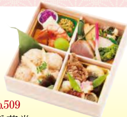
No.509 松花堂 19.7×19.7 cm ¥2,100+消費税